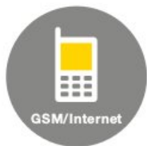
Meldungen und Steuerung